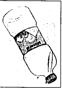
MEDIO 2. VICENS VIVES.