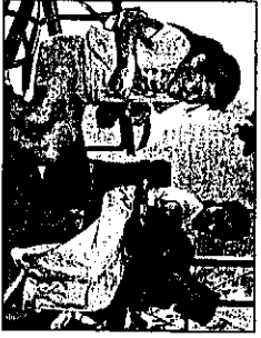
Flamenco en el aula.

EGB/ESO Contra el tabaco y el alcohol ..... 34 D. Bañeres