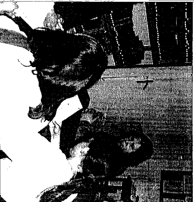
Entrevista con la Alcaldesa.