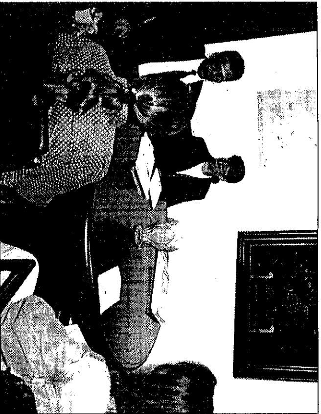
Entrevista con el Diputado.