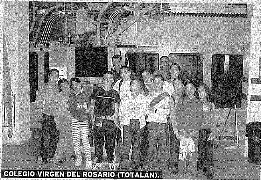
COLEGIO VIRGEN DEL ROSARIO (TOTALÁN).